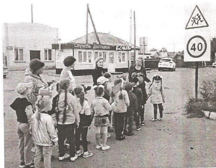
Экскурсия по улицам села. Знакомство с дорожными знаками.

Оснащение участка детского сада пешеходным переходом и светофором.