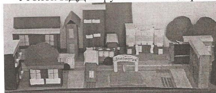
Макет «Улица нашего села»