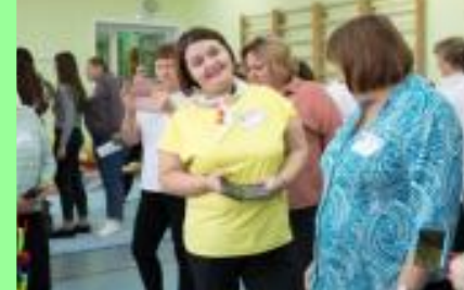
X Региональная школа - «Дошколка Алтая»