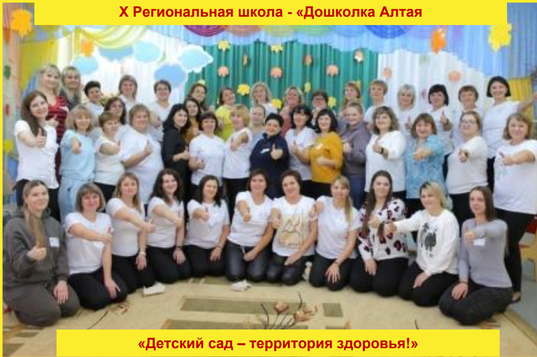
«Детский сад – территория здоровья!»