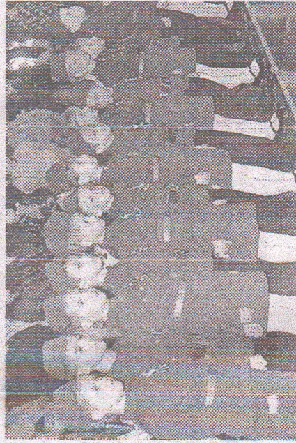
Юные солдаты из детских садов